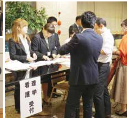
「liaison(リエゾン)」とは、フランス語で「つながり」という意味です